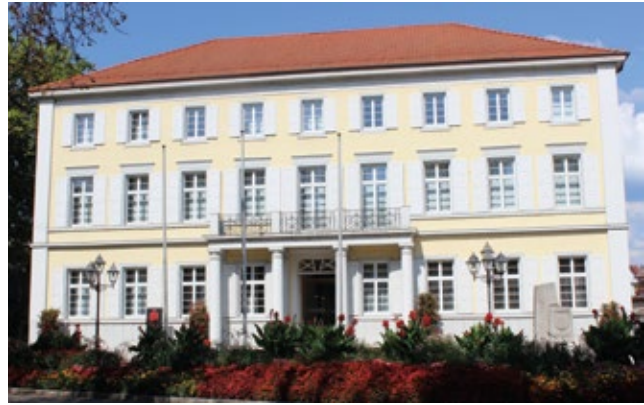
Damals (1890) und heute (2008)