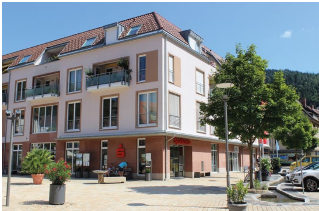
Im Zentrum von Hornberg gelegen präsentiert sich die Sparkasse in exponierter Lage am Bärenplatz, umgeben von Rathaus und einem Café.

Die neuen Räumlichkeiten standen ab dem 11. Juni 2007 den Hornberger Kunden zur Verfügung.