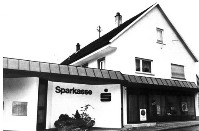
Die alte Sparkassenfiliale, das ehemalige „Kaufhaus Halter“, musste einem Neubau weichen.

Während der Bauphase wurden Beratung und Service in der gegenüberliegenden ehemaligen Postfiliale für den Zeitraum von 15 Monaten angeboten. Sowohl für Kunden als auch Mitarbeiter bedeutete dieses Provisorium eine Umstellung, doch sie sollte sich lohnen. Am 7.9.1999 wurde der Neubau feierlich seiner Be-