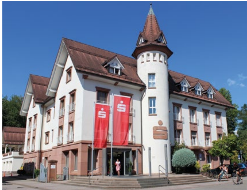
Das Sparkassengebäude in Zell mit seinem imposanten „Türmchen“.

Betroffen vom Umbau war in erster Linie die Kundenhalle. Die lichtdurchflutete Kundenhalle wurde zu einem „Banken-Marktplatz“ umgestaltet, wo man sich wohlfühlen kann. „Der technische Fortschritt und die geänderten gesellschaftlichen Wertvorstellungen sind auch an der Bankenwelt nicht spurlos vorübergegangen. Die Bedürfnisse der Kunden haben sich geändert, dem wird der Umbau der Sparkasse gerecht“, so schrieb die Presse.