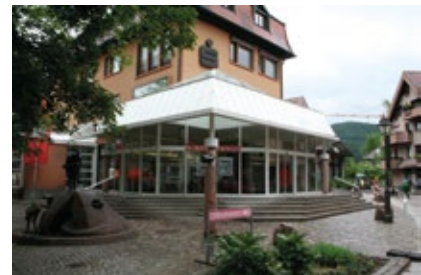
Das Sparkassengebäude vor dem Umbau mit den Treppenstufen und einem „Wintergarten“ als Foyer.

Die komplett umgebaute Hauptstelle war das letzte und bedeutendste Mosaiksteinchen im Zug der Modernisierung der verschiedenen Standorte. Offenheit und Transparenz standen dabei im Vordergrund. Am Sonntag, 18. Januar 2009, standen die Räumlichkeiten zur Besichtigung für die Öffentlichkeit offen.